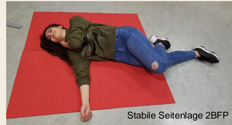
Stabile Seitenlage 2BFP