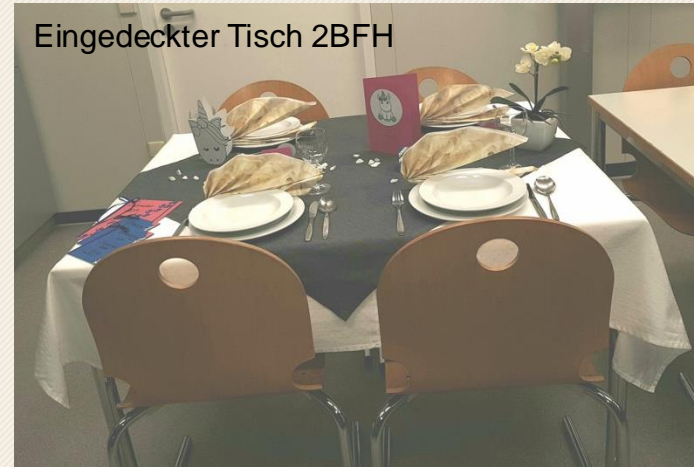
Eingedeckter Tisch 2BFH

Lernen Sie uns kennen... Wir freuen uns auf Sie!